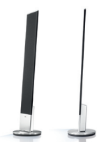
Individual Stand Speaker SL