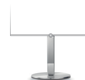
Center Floor Stand I 40-55