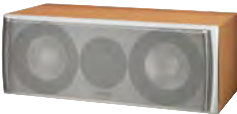
Quantum Center 513