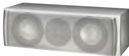
Quantum Center 511