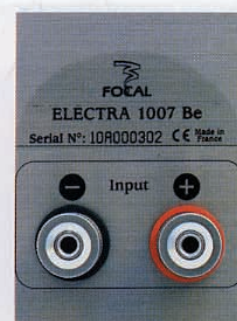
Focal est un des rares à rester fidèle au monocâblage, avec de très belles prises nickelées.