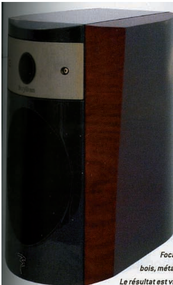
Sur cette Electra, Focal mêle avec bonheur bois, métal et acrylique noir. Le résultat est vraiment superbe.