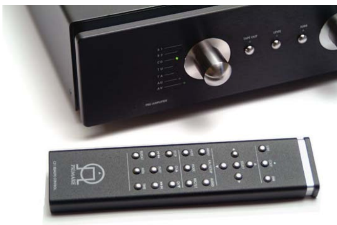
Molto bello il telecomando universale C31 Primare, compatto e interamente metallico con pulsanti piccoli ma ben sporgenti e quindi ergonomici.

La stabilità era già molto buona anche con un solo cavo e quindi non può migliorare più di tanto.