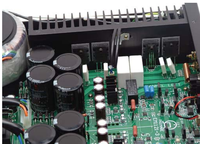
Il finale A-30.2 è veramente "dual-mono": due i trasformatori di alimentazione; nel particolare i 4 dispositivi d'uscita per ciascun canale.

900 della Labirinti Acustici e, ancora, con i Dromos Eos.