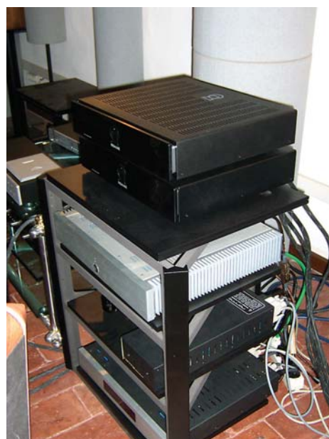
Foto scattate durante il set della prova nella saletta dell'autore.

ne scandinava. Che non sembra davvero difficile da capire, dal momento che il risultato sonico è sempre estremamente prevedibile . È stata prevedibile la risposta al cambiamento dei cavi, il cui carattere sonico i Primare hanno assorbito senza per questo rinnegare le proprie peculiarità di suono arioso e definito; è stato prevedibile il miglioramento della scena acustica col bi-wiring; è stata prevedibile la capacità di adattamento ai vari generi musicali, in particolare al jazz, che viene a godere di una luminosità tutta sua. Insomma, quando degli apparecchi sono così prevedibili, dimostrano di essere di razza buona , perché consentono una messa a punto dell'impianto estremamente accurata e continuamente migliorabile nel tempo. Soprattutto mi fa piacere trovare queste caratteristiche in oggetti di fascia media, dove la prevedibilità non è così scontata come dovrebbe essere nel segmento alto e altissimo. Finalmente mi permetto di passare al bi-amping. L'esperienza - vi dicevo - mi ha insegnato che le Image, probabilmente grazie alla loro impedenza estremamente regolare anche sulle frequenze di intervento del cross-over, danno ottimi risultati con la biamplificazione. Ed è con loro che faccio la prima prova. Cavi Dromos Eos. Sì, il miglioramento c'è, specie a livello di microcontrasto e di analiticità del suono. Non è una cosa impressionante, ma è chiaro ed evidente. Lì per lì - lo ammetto - rimango un po' deluso.