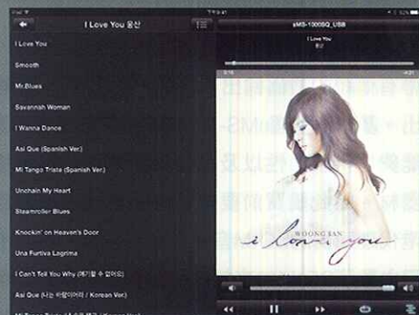
ipad 上安裝了logitech squeezebox Apps後就可以對它作無線操控