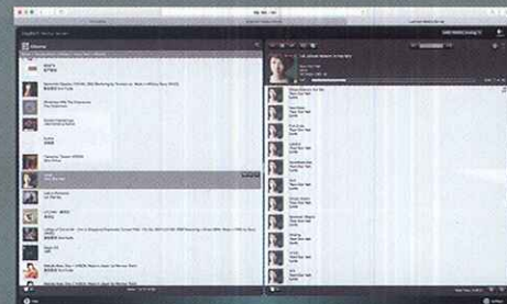
網頁版的操作版面