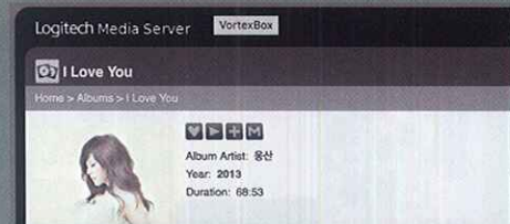
SOtM採用Logitech Media Sever平台