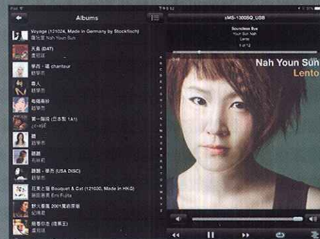
ipad版的操作版面相當易用和美觀