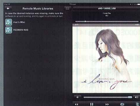
用家可以經這個Apps，播放NAS甚至電腦內的音樂檔案